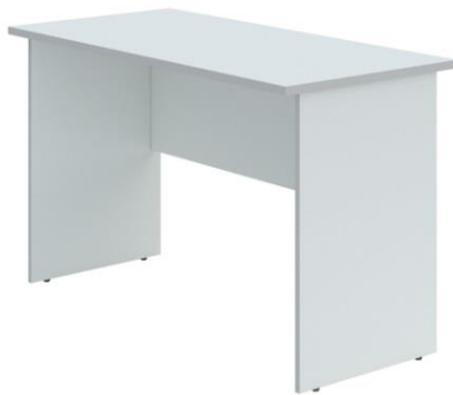
Стол письменный (ЛК-1200 С, ЛК-1500 С) ГОСТ 16371-2014